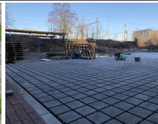
Příjezdová cesta – polopropustná dlažba