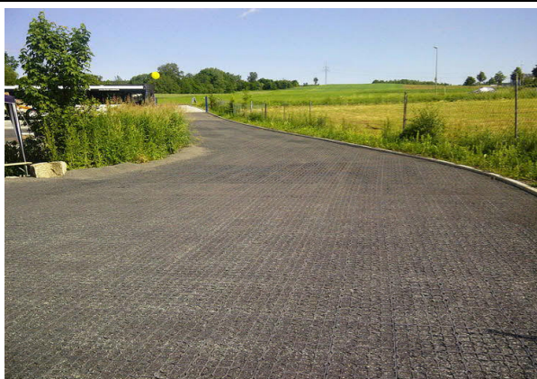
Příjezdová cesta - štěrkové rošty

možné docílit významné eliminace odtoku dešťových vod do kanalizace.