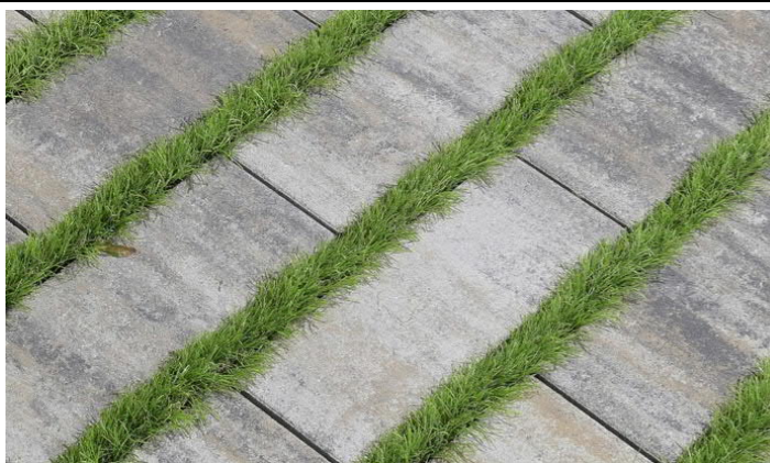
Příjezdová cesta – zatravněvací dlažba